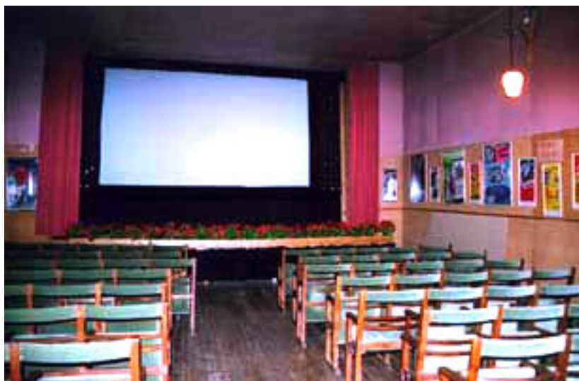
Gamla Sagabiografens salong.

Vad får man om blandar ett stycke genuin kultur, svensk arbetarhistoria, ett musikgeni, avfolkningsbygd, tallskog och mygg, ett knippe eldsjälar, uppfinningsriktighet, filmpremiär, galenskap och Jonas Gardell? Jo, man får succé. Och man får Sagabiografen med en årligt återkommande filmfestival i den lappländska obygden. Adak, för den som inte känner till det, består av några hus, en Konsumaffär, en skola och 170 invånare.